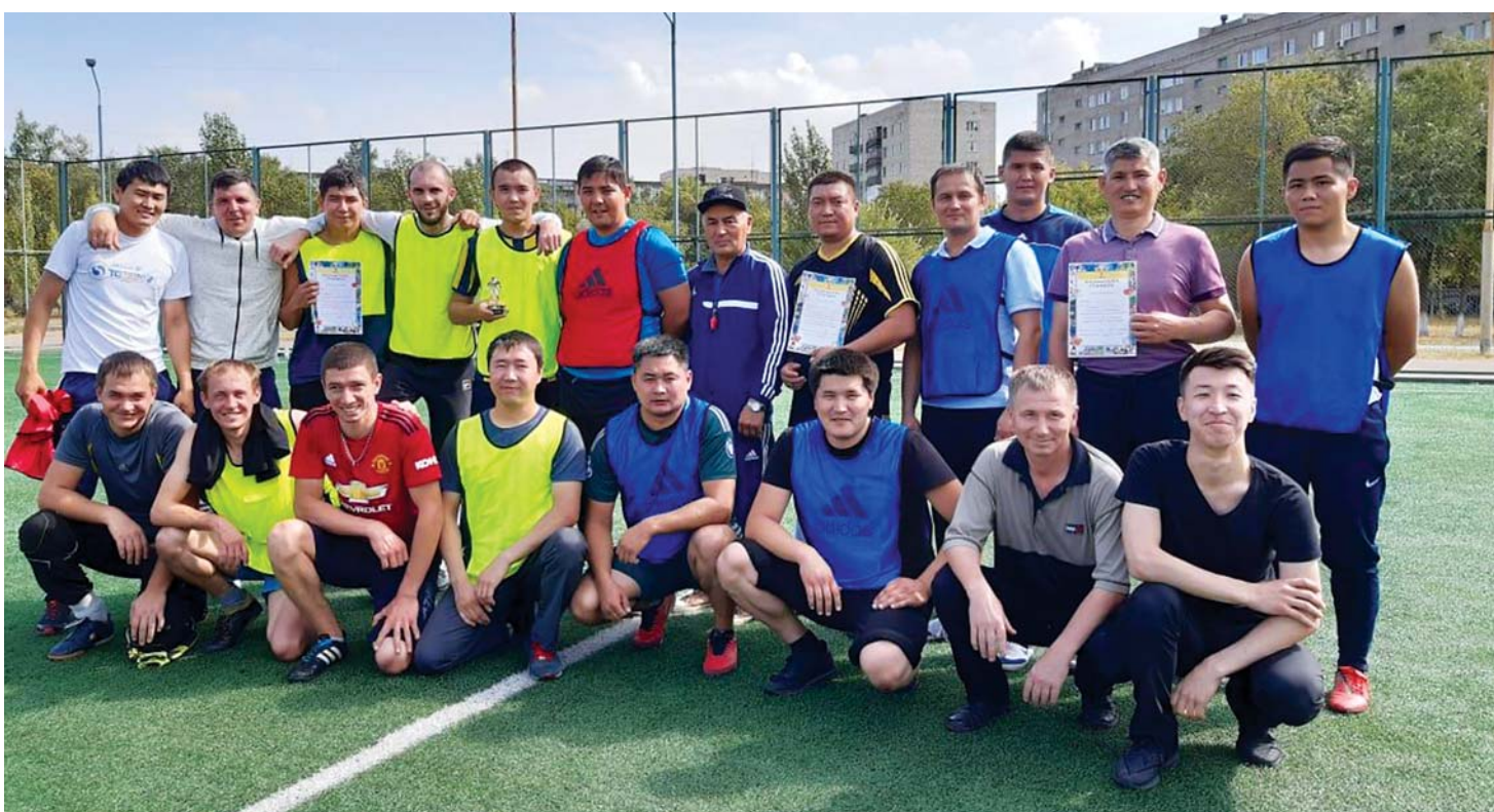
Работники ТОО «Тотал Сервис» после футбольного матча

ввели в календарь праздников постановлением Правительства от 22 мая 2019 года № 303 и закрепили за ним 10 октября.