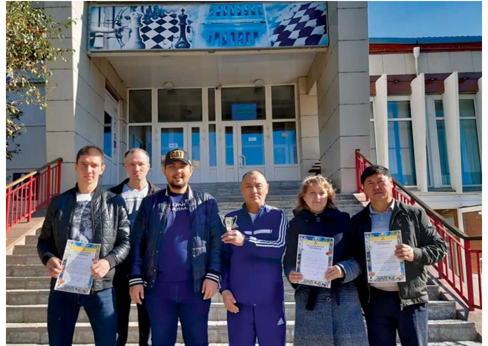
С наградами после шахматных баталий

Все представители структурных подразделений ТОО «Тотал Сервис» участвовали в соревнованиях с азартом и нешуточной волей к победе. Никто не хотел уступать противнику ни в волейболе, ни в мини-футболе, ни в бильярде, ни в шахматах, ни в шашках, ни в настольном теннисе. Именно этим последним видом спорта завершилась спартакиада в этом году. Последние соревнования посвятили Дню профессиональных союзов Казахстана. Эту дату