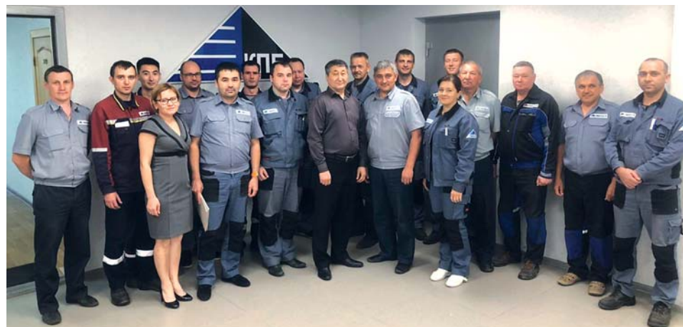
Коллектив ТОО «КазПромБезопасность ПВ»

Обучение проводилось в учебном центре «QHSE services» по пяти направлениям: «Промышленное обслуживание: механическое оборудование», «Безопасность оборудования для работы во взрывоопасной среде», «Заводское оборудование»,