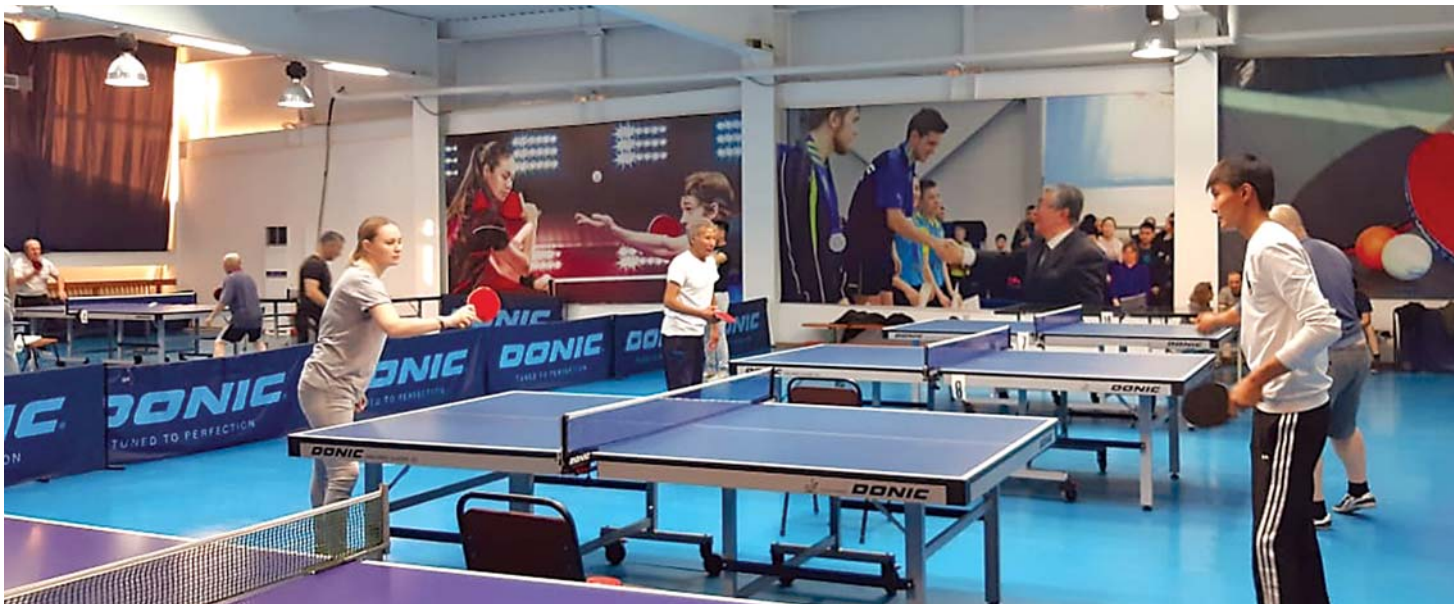
Сражение игроков в настольный теннис